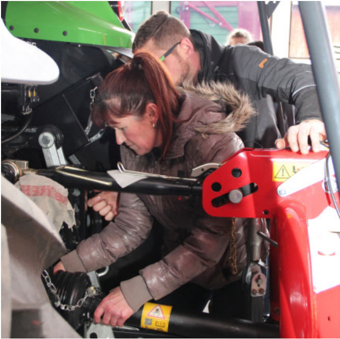
Learning by doing hieß es für die Frauen beim Anhängen des Kreislers.