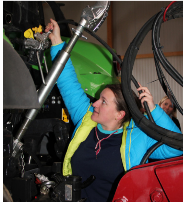
«Rot darf nie allein sein» lautet das Motto beim Anbringen der Hydraulikschläuche.

an diesem Tag nicht nur wertvolles Wissen und Tipps zum Umgang mit Landmaschinen, sondern durften auch selbst Hand anlegen. Denn »learning by doing« lautete das Motto des Tages. Und das Wichtigste: »Blöde Fragen gibt es nicht.«